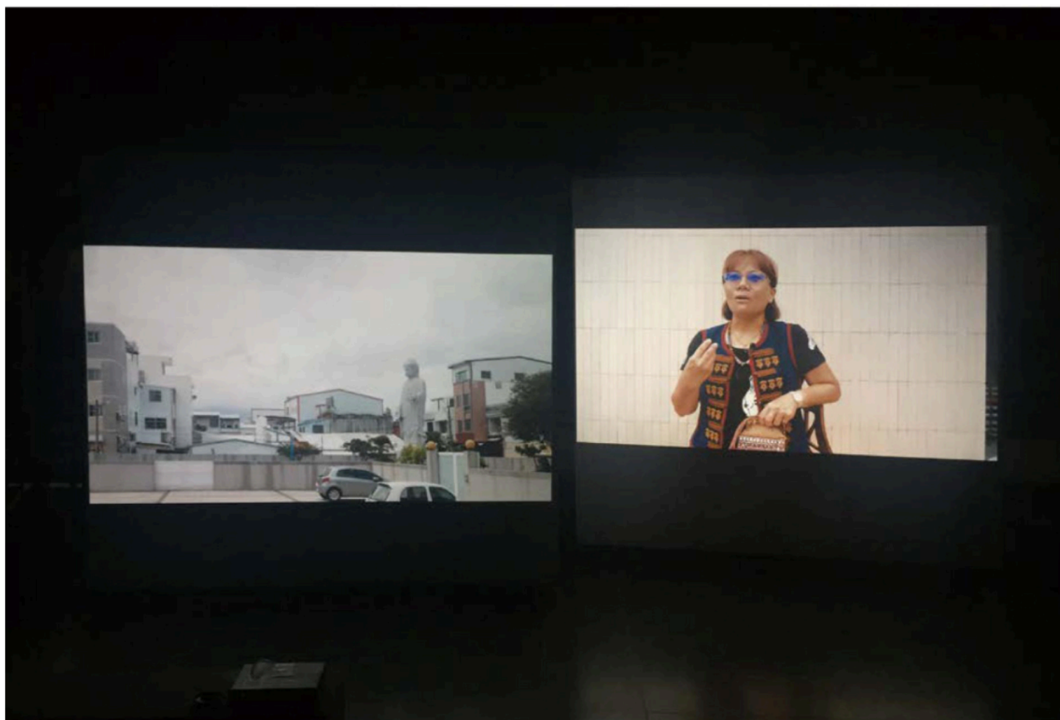
沒有人走路的城市 The City Where No One Walks | 多頻道錄像 | 2019

在2021年，我會去東京三個月，創作並展出東京雙年展，這原本是今年的計畫，但因為疫情延期了。另外，本來今年八月也要去法國巴黎西帖駐村，也因為疫情的關係延期了，所以可能會延到明年，這兩個都是我期待的駐村計畫。