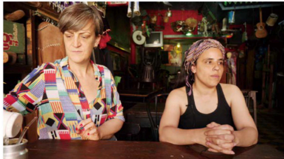
Republic of La Boca | 三頻道錄像 | 2020