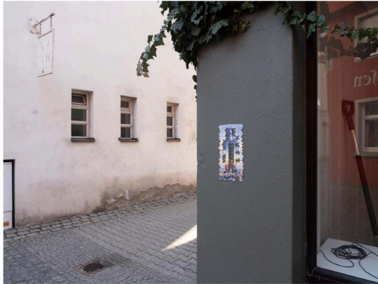
I came here to play your game, drink my tea | 拼圖·互動·行為 | 2019